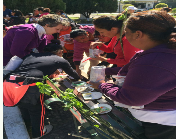
195 femmes de programmes sociaux (Programa Oportunidad)