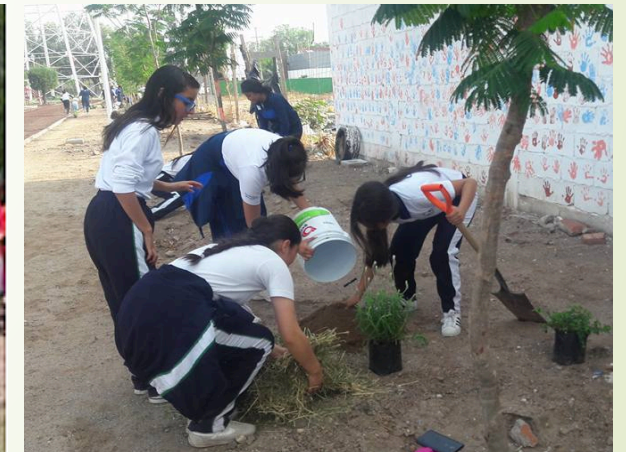
1 intervention dans un parc