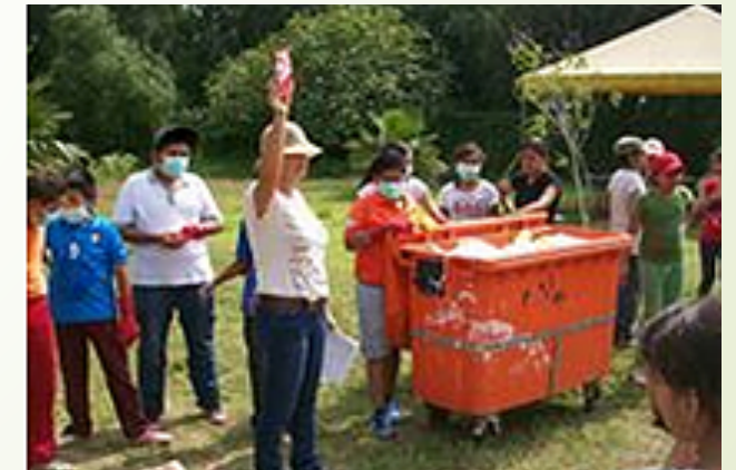
Soutien à la communauté