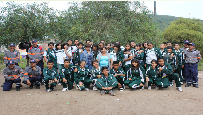
220 élèves de secondaire

Renforcement des compétences pour la durabilité (UNESCO): Réflexion systémique, analyse critique, prise de décision collaborative, sens des responsabilités envers les générations présentes et futures.