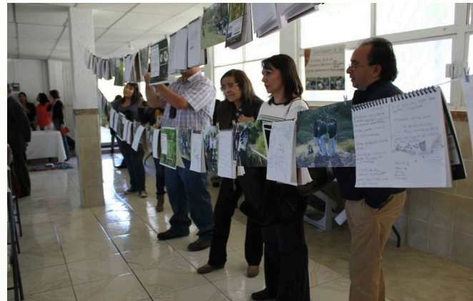
Forum de communication