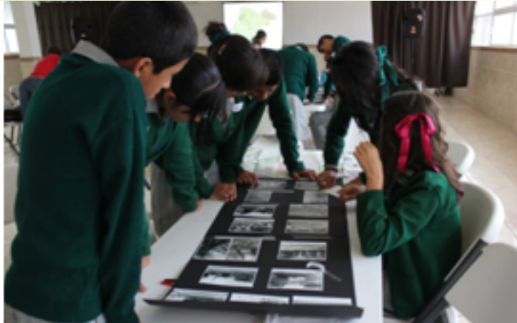
Ateliers en classe