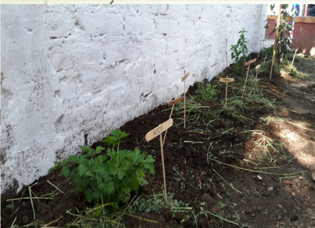
3 Potagers scolaires

Enrichir notre connaissance du monde, à partir d'une vision systémique , pour comprendre et transformer notre environnement urbain-local vers la durabilité et la résilience